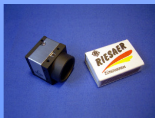
Größenvergleich der Kamera mit einer Zündholzschachtel

Das Besondere des FMMP 02 ist der kompakte und modulare Aufbau in Verbindung mit einem großen Sehfeld. Dadurch findet der Mikroskopmessplatz Anwendung in allen Gebieten der Technik, in denen es auf schnelle Objekterkennung ankommt. Das System ist sowohl als Tischgerät einsetzbar, als auch zur Integration in Maschinen und Anlagen geeignet. Durch eine Vielfalt von Beleuchtungsmethoden, Zusatzobjektiven, Okularen und Möglichkeiten der Bilderfassung (Fotografie und Videoübertragung), kann der Mikroskopmessplatz FMMP 02 anwenderorientiert verschiedensten Arbeitsaufgaben angepasst werden.